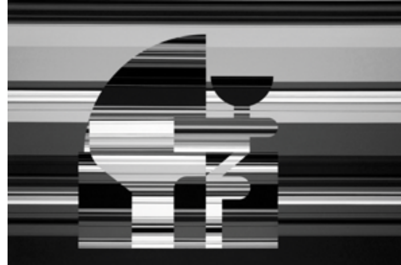
Ján Vasilko: Návrh na Múzeum súčasného umenia v Košiciach pre rok 2013, verzia 7, 2009, akryl, 180 x 250 cm

Zatiaľ poslednou sériou obrazov sú Návrhy na Múzeum súčasného umenia v Košiciach pre rok 2013 (2009 – 2010). Vnímam ich ako súhrn autorových umeleckých otázok a odpovedí. Nájdeme v nich echá na tvorbu skoršieho dáta, ale autor nás ušetrí pocitu dejá vu. Návrh na Múzeum súčasného umenia v Košiciach pre rok 2013 , verzia 5 (2009) je pokračovaním výskumu predstaveného obrazom Hokej – Duch (2008), je však dôkazom toho, že autor je i za jeden rok schopný prejsť poriadny